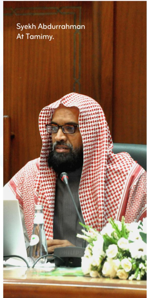
Syekh Abdurrahman At Tamimy.

Secara Terminologi, ini adalah pantangan bagi wanita untuk tidak mengenakan perhiasan dan hal-hal serupa lainnya selama periode waktu tertentu dalam keadaan tertentu.